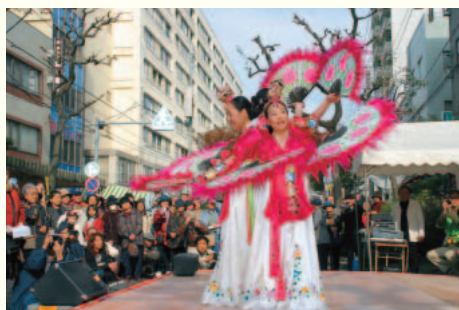
リトル釜山フェスタ