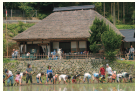
農業体験(歌野清流庵)