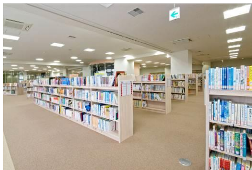
4 階 児童図書コーナー