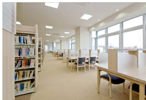
5 階 一般図書コーナー