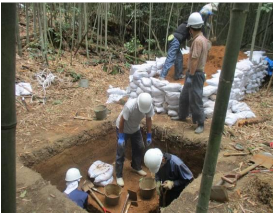
秀波古墳群ほか試掘・確認調査