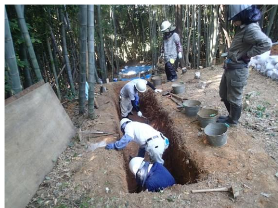
茶臼山古墳確認調査