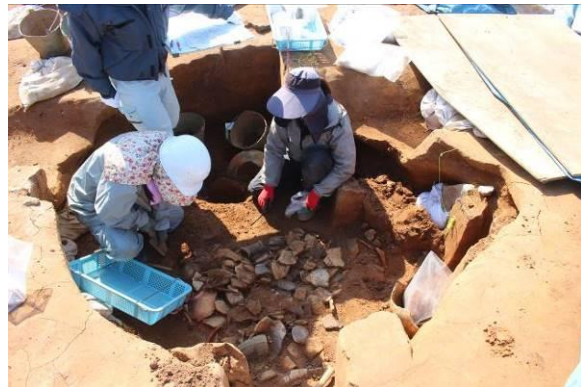
綾羅木郷台地遺跡（木船地区）工事立会