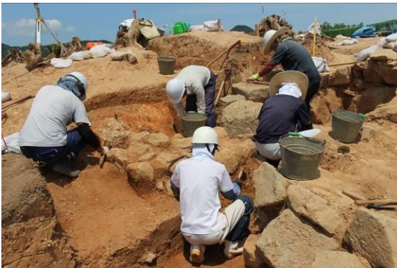
丸小山遺跡発掘調査