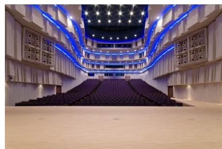
大ホール（海のホール）