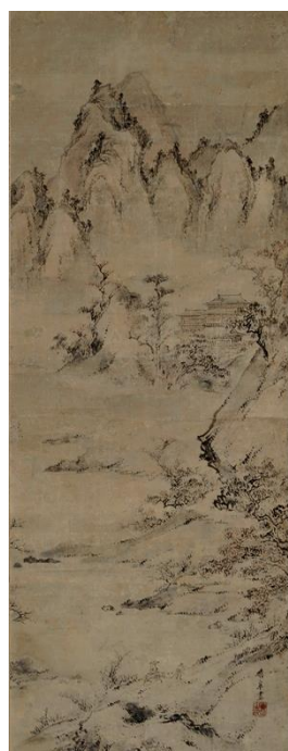
狩野晴皐《楼閣山水図》 慶応3年[1867]以前 紙本墨画淡彩、軸・1幅 平成29年度寄贈