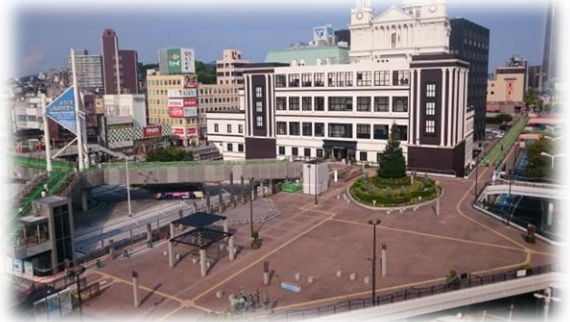
下関駅前人工地盤全景

施設名称：下関駅前人工地盤 場所：下関市竹崎町四丁目ほか 延長等：L=840m、A=6,400m 2 、 規格：自歩道、W=1.5~6.6m エスカレーター5箇所（10基） エレベーター2基 架設年次：平成元年から8年