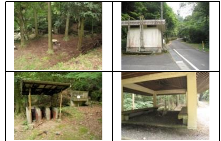
【過去5年以内に実施した工事の内容】 (単位:千円)