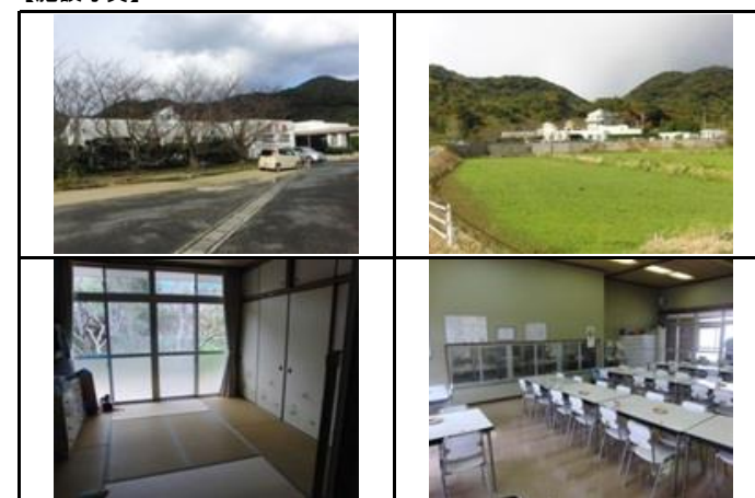
【過去5年以内に実施した工事の内容】 (単位:千円)