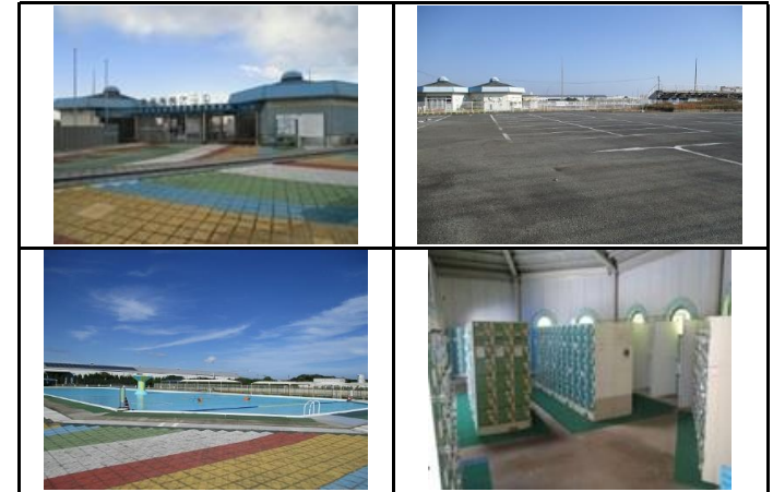
【過去5年以内に実施した工事の内容】 (単位:千円)