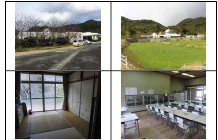
【過去5年以内に実施した工事の内容】 (単位:千円)