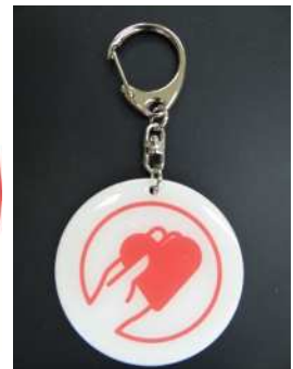
キーホルダー（直径 60mm、アクリル製）