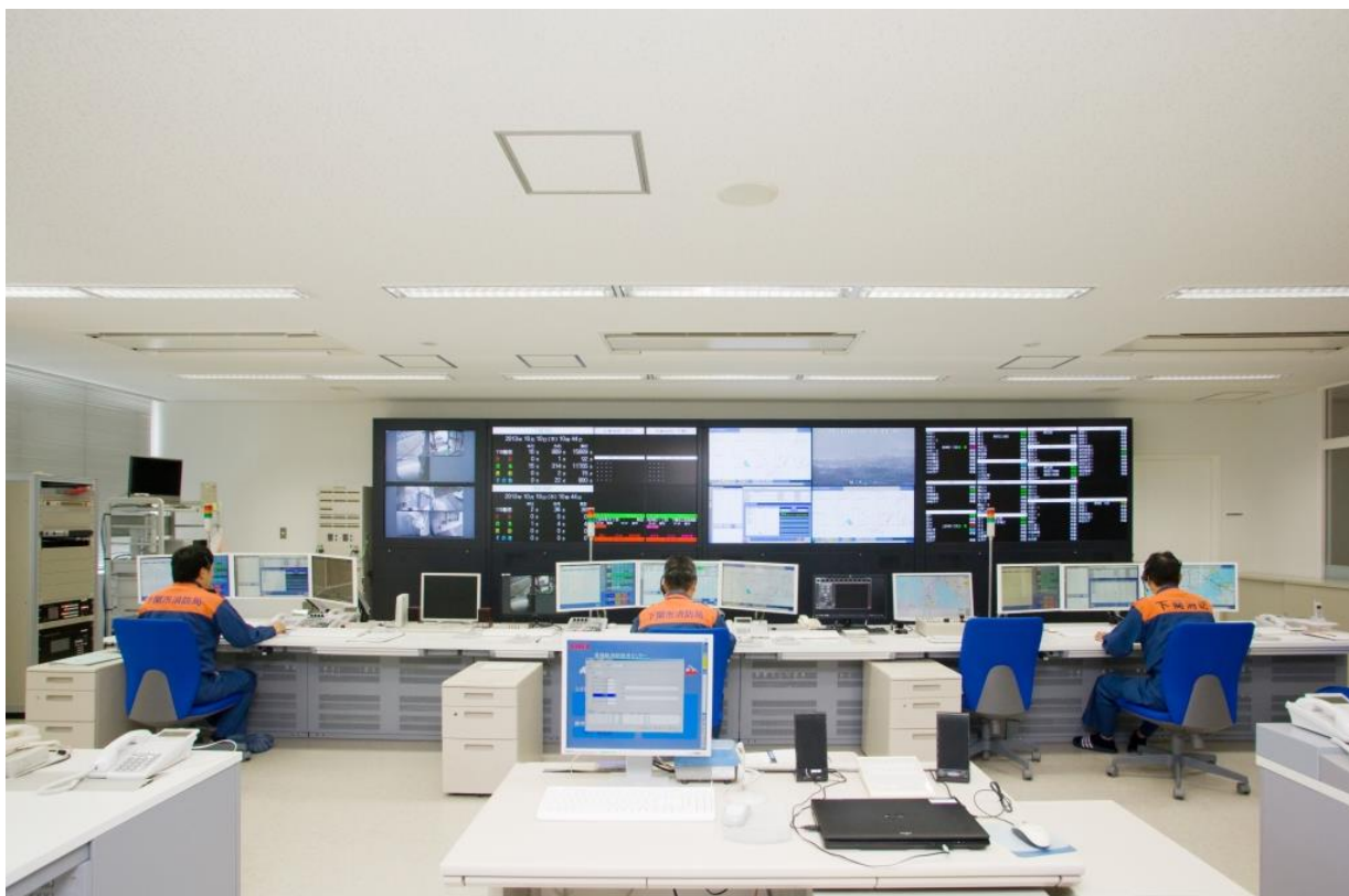
下関市・美祿市消防指令センター