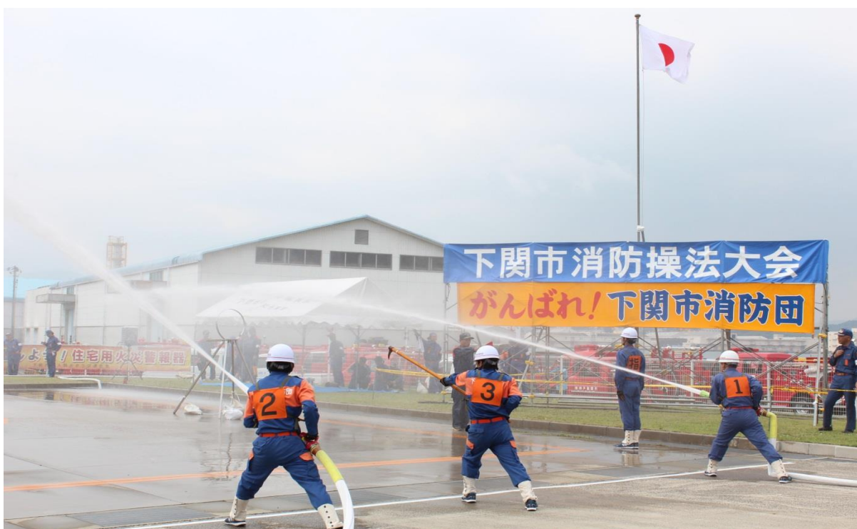
下関市消防操法大会