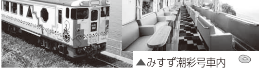
▲みすゞ潮彩号車内

みすゞ潮彩号にらーじくんヘッドマークを装着した車両を使用し、下関駅～仙崎駅間(下関駅発着)で貸切列車を運行します。車内ではサックスの生演奏を予定しています。※長門市では温泉などのオプションツアーあり。料金や旅程など詳細は市ホームページか(株)日本旅行TIS下関支店で確認を 11月21日(金)午前10時～午後6時(予定) 定員88人(先着順) 11月14日(金)までに、直接来店か電話で、(株)日本旅行TIS下関支店(市内竹崎町四丁目3番1号 ☎223-1322)へ。 交通対策課(☎231-1441)