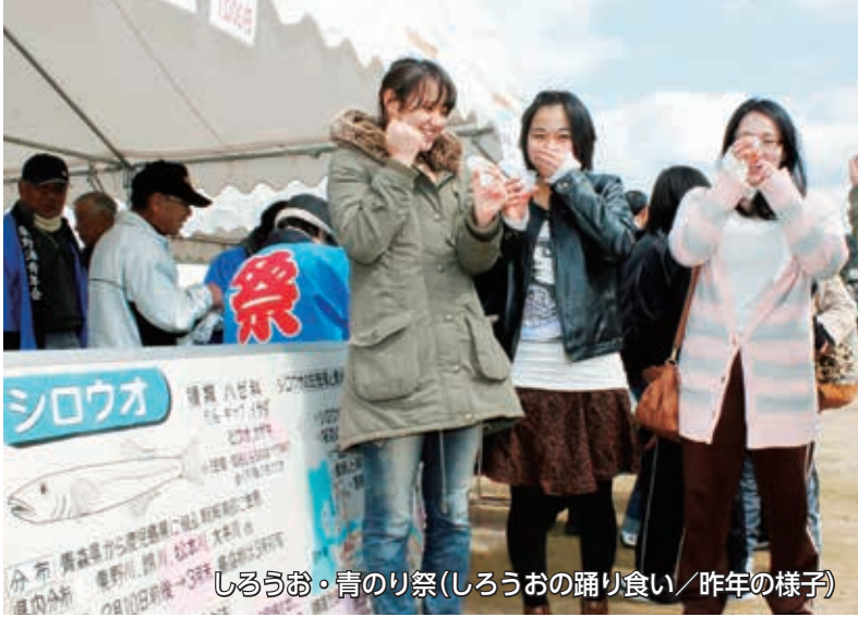
しろおお・青のり祭(しろおおの踊り食い/昨年の様子)

必 ●申し込みの必要事項＝ 必 申込時に必ず次の項目の記入を。 希望の催し・講座名、郵便番号、住所、氏名、年齢(学年)、電話番号 ※往復はがきは、返信面にも住所、氏名の記入を