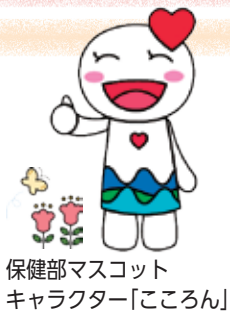
保健部マスコット キャラクター「こころん」