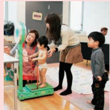
▲1歳6カ月児健診(唐戸保健センター)