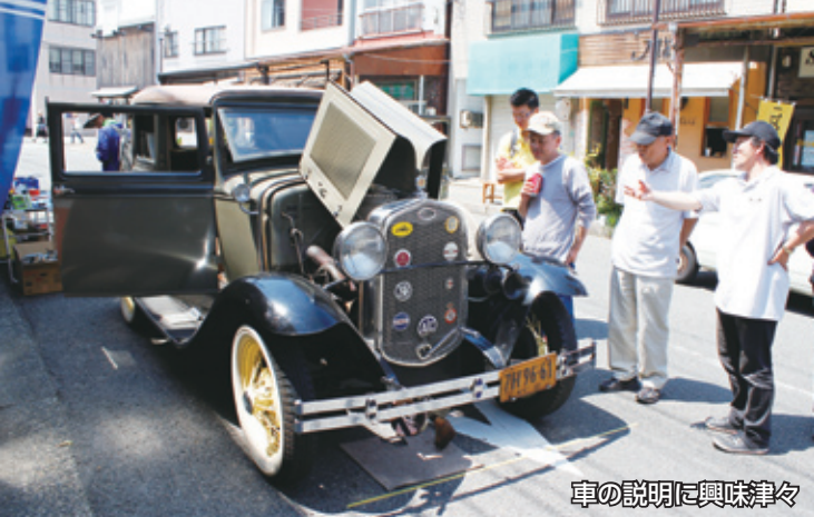
車の説明に興味津々