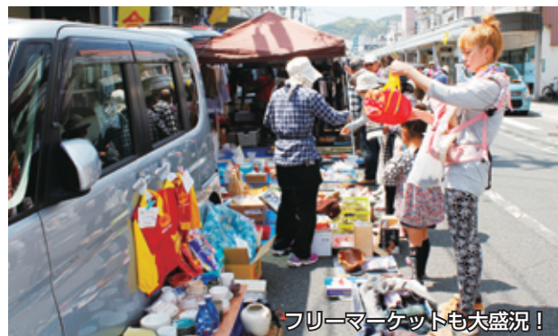
フリーマーケットも大盛況!