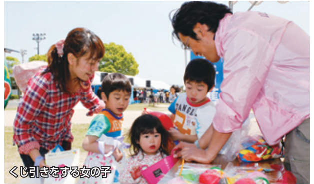
くじ引きをする女の子

5月10日、豊北総合運動公園で第15回元気ファミリーフェスタが開催され、大勢の親子連れが訪れました。会場では、犬やウサギなどと触れ合える動物コーナーや、手作り木板を使い親子で火を起こすコーナーなどがあり、あちこちで歓声があがっていました。参加した保護者からは「親子で作ったり、子どもが多めの友達と遊べたりするので、来年もまた来たい」といった声が聞かれました。