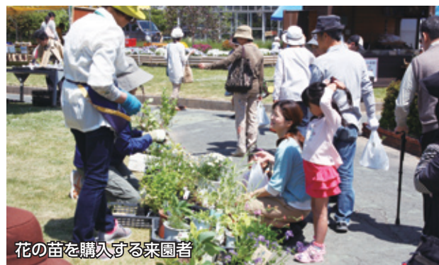
花の苗を購入する来園者

5月11日、「植物とのふれあい」をテーマとした、花・緑いっぱいイベント「フラワーフェスティバル」を園芸センターで開催しました。 会場では、苗・