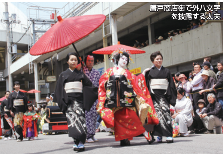
唐戸商店街で外八文字を披露する太夫

初夏の関門海峡を彩る一大絵巻、「しものせき海峡まつり」が5月2日、4日にかけて市内で盛大に開催されました。 3日は華やかな衣装を身に付けた