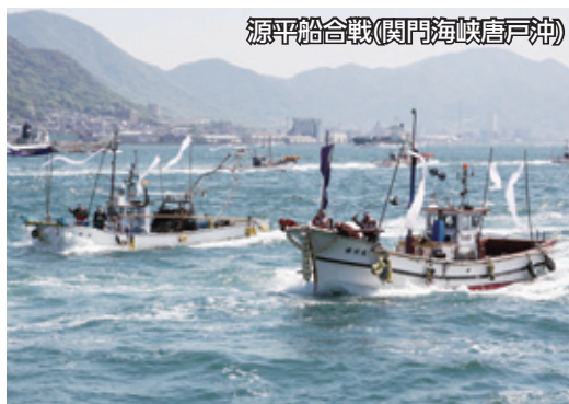
源平船合戦(関門海峡唐戸沖)

4日には、巖流島で武蔵・小次郎決闘の再現をはじめ、関門対抗綱引き大会やファミリーピクニックコンサートなどもあり、期間中39万人の人出でにぎわいました。