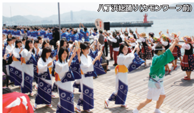
八丁浜総踊り(初モンワー前)

5月11日、長府商店街で長府れと祭りが開かれ、フリーマーケットやクラシックカーの展示、長府のグルメを決める長府C1グランプリなどがありました。