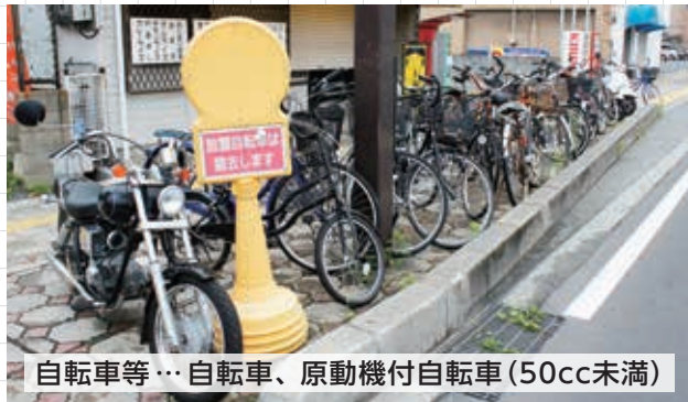
自転車等…自転車、原動機付自転車(50cc未満)

「下関駅にぎわいプロジェクト」により、きれいに生まれ変わった下関駅周辺。しかし、まだ解決されていない問題が1つ…。それは 放置自転車 。歩道上などに放置された自転車等は歩行者にとって迷惑だけでなく、救急活動の妨げとなったり、まちの景観を害したりと、さまざまな問題を引き起こします。