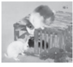
1909年 竹内酒風(家光) 北海道近代美術館蔵

●特別展「北海道近代美術館コレクション」選 日本画逍遙 期11月13日~12月27日 ※月曜休館(11月23日は開館) 図「北国の個性」に注目しながら、明治から現代までの約60点の作品 1000円、大学生800円 【関連催事】