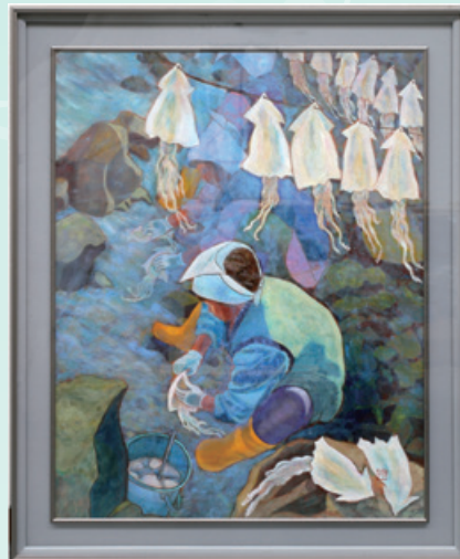
▲市長賞 日本画 奥村 恒子【朝光】