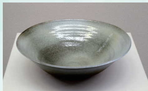
▲市長賞 工芸 荻北 好美【白釉掛分鉢】