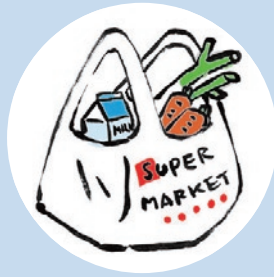
食費、学費、公共料金、 生活用品費など (人件費、物件費)