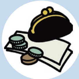
保険料・交際費など (補助費等)