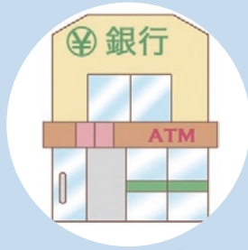
ローン返済 (公債費)