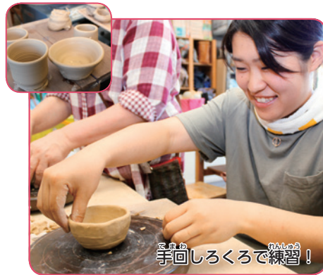
手回しろくろで練習!

今回は美術館で行われている、 友の会同好会の一つ、「陶芸同好会」 を取材してきたよ。陶芸同好会の 会員は59人。普段は、会員の個人 で作ることはできないけど、今回 特別に陶芸体験をさせてもらった から紹介するね。