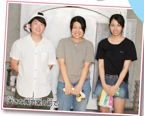
大きな陶芸窯の前で