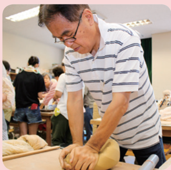
陶芸同好会の活動の様子