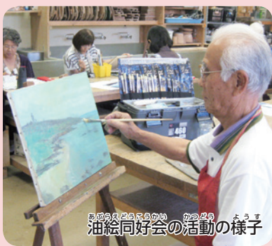
油絵同好会の活動の様子