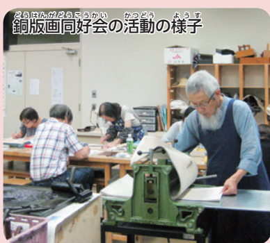
銅版画同好会の活動の様子