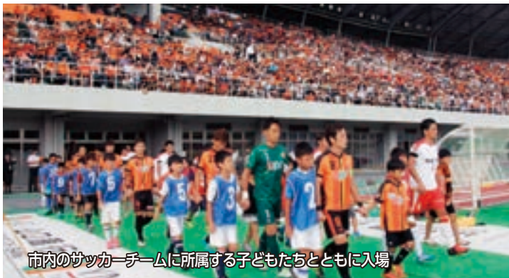
市内のサッカーチームに所属する子どもたちとともに入場

※開所時間は平日の午前9時～午後5時まで。第1、第3木曜日の午後5時～7時は交付のみ受け付け