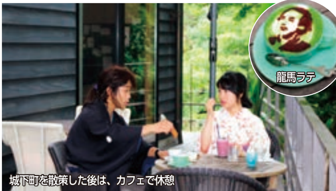
城下町を散策した後は、カフェで休憩

長府毛利邸では11月27日まで甲冑・ かつ 官女衣装着付け体験を実施しています。今年は、新しい企画「カップル限定！晋作・龍馬カップルで町歩き！」が登場。晋作とおうのや龍馬とお龍のように当時をイメージした衣装に身を包み城下町を散策してみませんか？