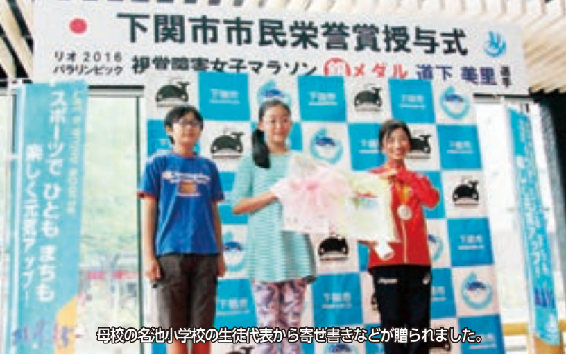
母校の名池小学校の生徒代表から寄せ書きなどが贈られました。