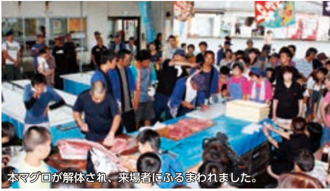
本マグロが解体され、来場者にふるまわれました。