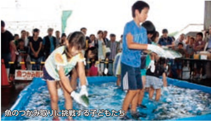
魚のつかみ取りに挑戦する子どもたち