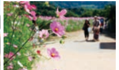
満開のコスモスに目を奪われます！（Uフレッシュパーク豊浦）