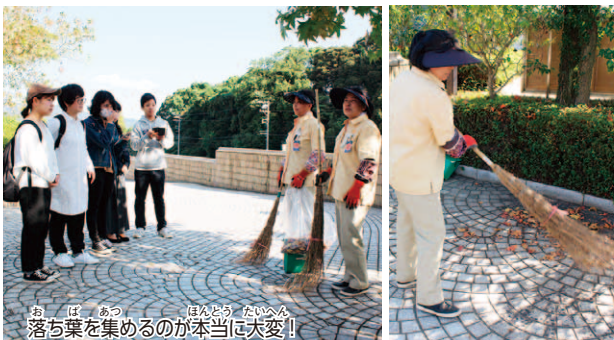
落ち葉を集めるのが本当に大変!

美術館には24時間体制で勤務 している警備員がいるよ。主な仕 事は、開門などの開館の準備や、 閉館作業、館内の見回りなどだよ。 来館者が帰った後も美術館に残り、不審者がいないか、危 険なものがないか見回りをしているよ。夜の見回りは、見回 るルートが決められていないし、暗くてもライトをつけない のがルールなんだ。理由はルートを決めたりライトをつ けたりすると不審者からルートや見回りの時間に気付かれ てしまうからなんだよ。 警備員は、危険な場面に出会うこともあるから、護身用 の道具も身に付けているんだよ。美術館を安全な空間に保 つためには必要な仕事の一つなんだね。