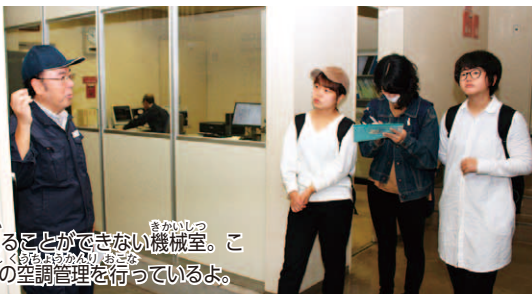
普段は入ることができない機械室。こ こで全館の空調管理を行っているよ。

美術館全般の清掃を行う清掃員 は、開館前の午前7時~9時30分 までは美術館の建物の中、その次 は外を掃除。普段は人が入らない 屋上や、野外彫刻の周りもきれいにしているんだ。 皆さんが落ち着いて美術品を楽しめるために、毎日きれ いな状態に清掃員が保ってくれているんだね。