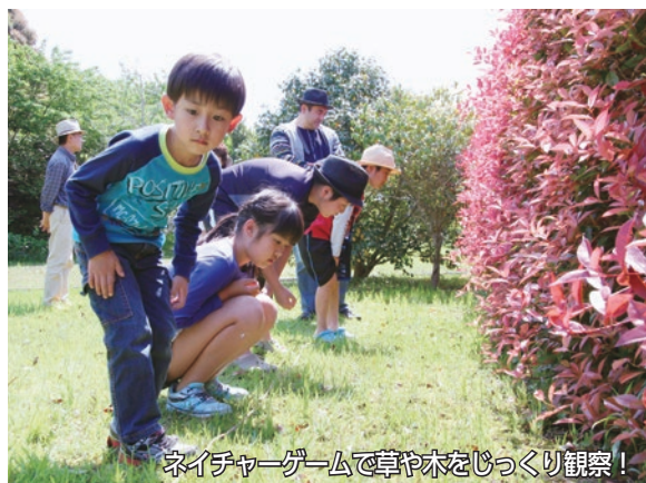
ネイチャーゲームで草や木をじっくり観察！

4月29日～5月5日までの期間中、さまざまな種類の花が咲いている自然豊かな公園内で、親子連れで楽しめるイベントが開催されました。