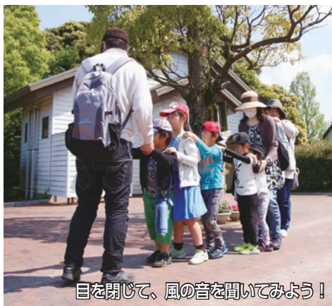
目を閉じて、風の音を聞いてみよう！