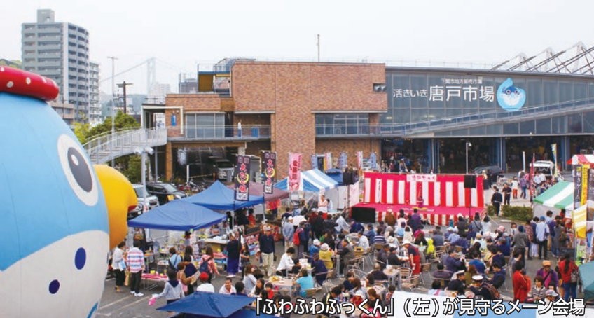
「ふわふわぷっくん」(左)が見守るメイン会場