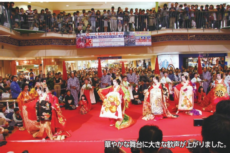
華やかな舞台に大きな歓声が上がりました。