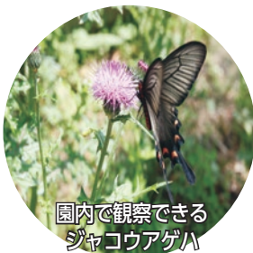
園内で観察できる ジャコウアゲハ