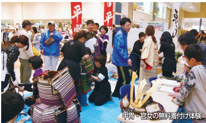
かっぱあがり 甲冑・官女の無料着付け体験