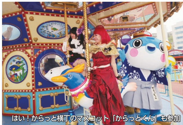
はい！からっと横丁のマスコット「からっとくん」も参加