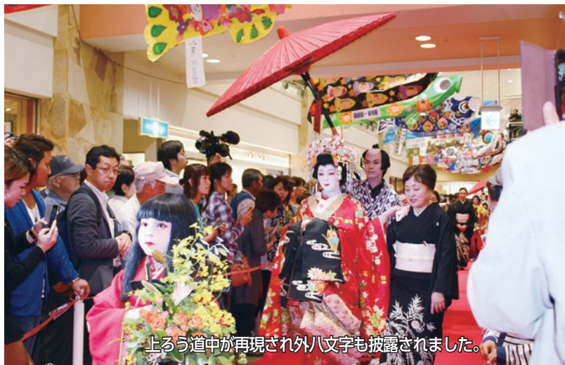
上ろう道中が再現され外八文字も披露されました。