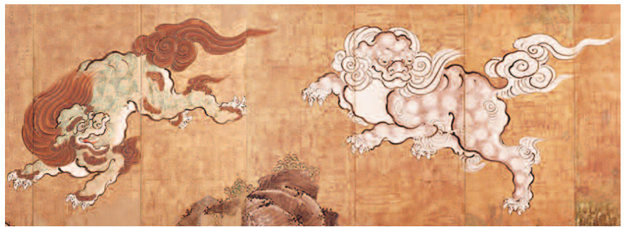
▽《唐獅子図屏風》(部分) 市立美術館蔵