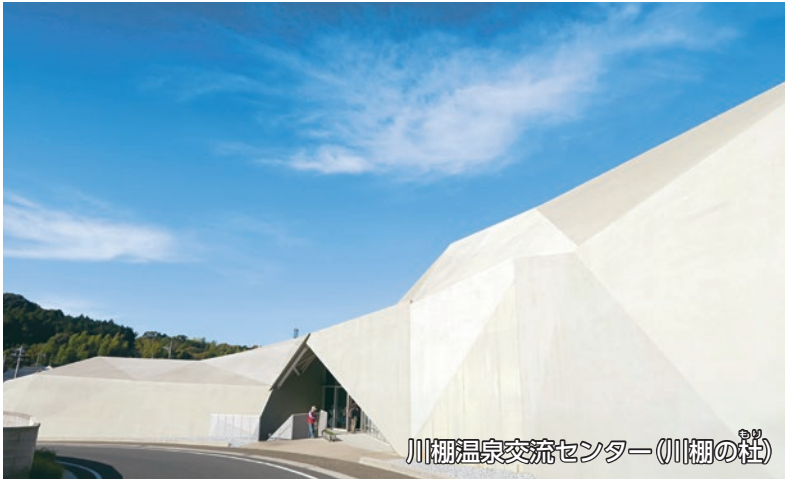
川棚温泉交流センター(川棚の杜)