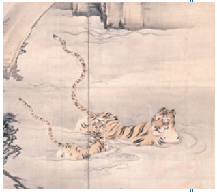
▲狩野芳崖「虎図」部分