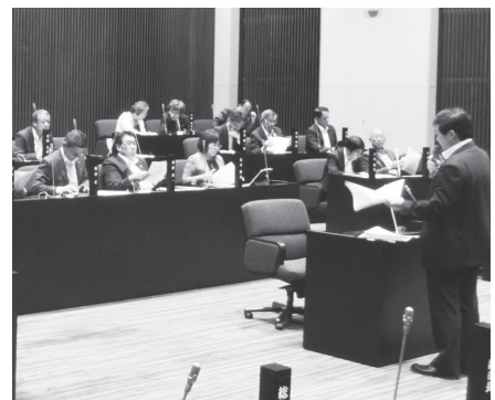
▲議場で行われた研修の様子

今年度は、議員改選後、最初の年度でもありますので、本計画をより実効性のあるものとするための訓練などを行いました。 全議員を対象として、9月2日には連絡体制の確保について、改めて確認するため、NTTが運用する災害用伝言ダイヤル(17)や災害用伝言板について実地訓練を行いました。また、9月25日には本計画の要点について改めて確認するための研修も行いました。 今後も本計画の実効性をさらに高めるために、さまざまな角度から検証、点検を行い、必要に応じて見直しを図るとともに、万が一、大規模な災害が発生した場合は、本計画に基づき、市議会としてとるべき行動を的確に判断し、市と連携して早期復旧・復興を目指していきます。 固議会事務局議事課(☎231-4121)