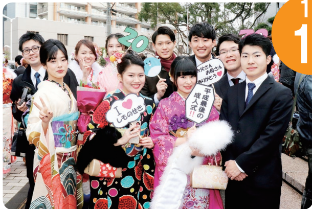
▲平成31年1月 市民会館