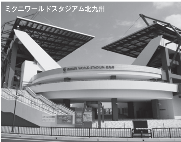
ミクニワールドスタジアム北九州

①JR貨物門司機関区と太刀浦コンテナターミナルほか 回 6月20日(木) 回40人 回6,300円 回 6月6日(木)までに、アーバンツーリスト(☎093-961-3370)へ。 ※昼食付(三井倶楽部) ※対象は小学3年生以上 ②ミクニワールドスタジアム北九州バックヤード見学と九州電力新小倉発電所ほか 回 6月26日(水) 回40人 回6,800円 回 6月12日(水)までに、西日本旅行リバーウォーク北九州支店(☎093-583-1200)へ。 ※昼食付(焼肉の龍園小倉本店) 回北九州産業観光センター(☎093-551-5011)