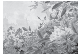
▲高島北海《富士登山図第七図(富士草花)》

アール・ヌーヴォーにも関連する壮大な世界観・宇宙観のもとに生きた19世紀から20世紀の作家たちを紹介。 回 7月7日(日)まで ※休館日…月曜日 【関連行事】 ●ギャラリートーク = 回 6月22日(土)午後2時～3時 ※要観覧受け付け 回一般200円、大学生100円 回市立美術館(☎245-4131)