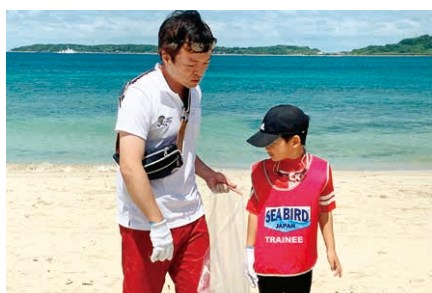
豊北町で息子とビーチクリーンに参加

NGH 小学3年生の時に父親の影響でボウリングを始め、2年後の全国大会で2位となる。