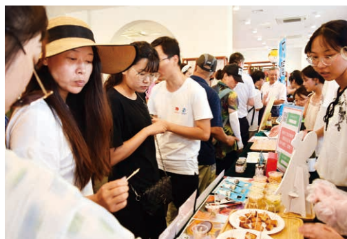
▲下関市観光物産展(青島国際ビール祭り会場内)