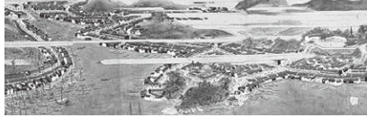
▲狩野芳崖《馬関真景図巻》1842年(部分)

古くから国際色豊かな海峡のまち・下関。この地にゆかりある近世の文人や絵師、近代美術の立役者となった狩野芳崖から現代の作家までの作品を紹介します。 開 9月19日～10月20日 ※休館日…月曜日(祝日を除く)、10月1日(火) 観 一般200円、大学生100円