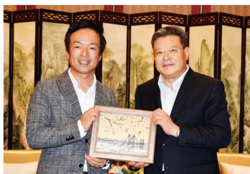
▲前田市長、孟凡利青島市長