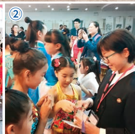
〈写真①②〉青島市へ訪問した本市小学生(平成30年10月) 〈写真③〉青少年文化芸術団(馬関まつり/平成30年8月)