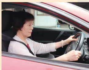
▲視野検査の様子。年齢とともに視野は狭くなると言われています。