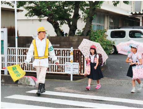
▲雨の日も立哨指導を行ないます。

交通事故が多い交差点は、通勤などで交通量の多い朝と夕方事故が集中しています。子どもたちが安全に登校できるように、交差点で立哨指導(交差点などに立って交通指導をすること)をして地域に貢献している人たちがいます。