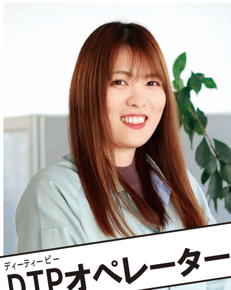
ディーティーピー DTPオペレーター

このページは、小・中学生、高校生を対象に市内で働く人・職業を紹介しています。先輩たちのメッセージを参考に、未来の自分を探してみませんか。