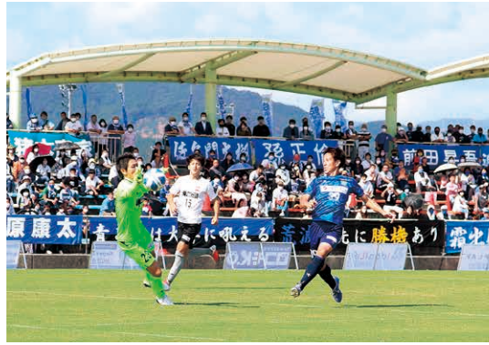
◀乃木浜総合運動公園。満員のサポーターの前でのCSLチャンピオンシップ2020決勝(9月27日)。