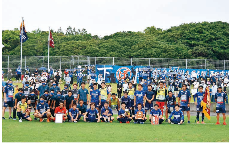
▲県サッカー選手権の優勝を喜び選手、スタッフ、サポーター。