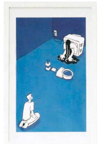
▲市長賞/イラスト 濱 七海