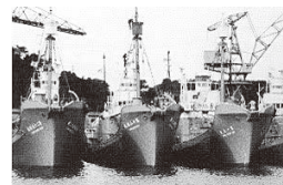
▲下関漁港の捕鯨船