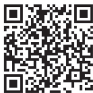
▲市ホームページ 新型コロナウイルス 感染症統合情報