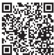
▲市LINE公式アカウント友だち登録