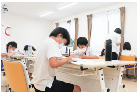
▲遊んだ後は勉強。自然に机に向かい、私語がなくなり、集中できる環境になります。

皆繋は、平成28年に設立され、居場所や活動場所の提供、社会課題の調査など、さまざまな活動を行っています。法人は、現在、正会員13人、そのうち4人がスタッフとして活動しています。みんなをたなく場所として開設された「こみゆすぽ安岡」では、無料で、遊びや食事の提供、学習支援が行われています。スタッフの他にも学生ボランティアの方などが一緒に過ごします。法人を設立した代表理事