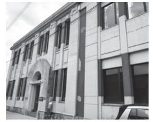
▲蜂谷ビル・旧東洋捕鯨下関支店建物

明治期に入り、廃藩置県により各藩との強いつながりのあった鯨組による古式捕鯨は衰退しますが、代わって近代捕鯨が各地で試みられるようになります。1899(明治32)年には我が国初の近代式(ノルウェー式)捕鯨会社である日本遠洋漁業株式会社が山口県で創立され、長門に本社を、下関に出張所と倉庫が設置されたことにより、下関と長門、いわゆる山口県が近代捕鯨発祥地となりました。日本遠洋漁業はその後、再編合併を経て、東洋漁業、東洋捕鯨、日本捕鯨となり、現在の日本水産につながる会社となります。