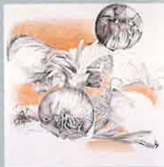
《作品A（たまねぎ）》色鉛筆・紙

コラージュを油絵で表現した作品は、1930年代後半頃に、コラージュ作品の制作とともに多く描かれました。このようなリアルな油絵が描けたのは、彼女の手先の器用さと前述のような基礎学習が関係しているのでしょう。