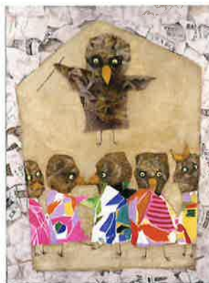
《雀の学校》油彩、紙・板、1973年