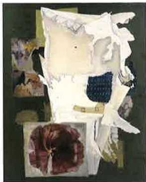
《作品2》油彩・キャンバス、1940年

物質性を追求したようなリアリティある画面、重量感を取り除いた画面、キャラクターズティックに社会を風刺したような作品、そのどれもが彼女の本質であるといえるのです。