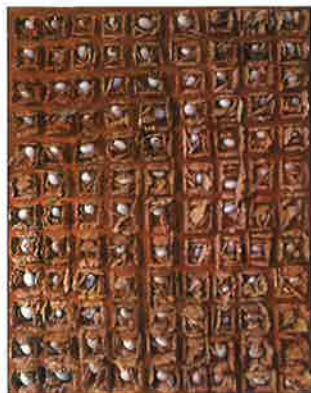
《作品》油彩・キャンバス、1978年