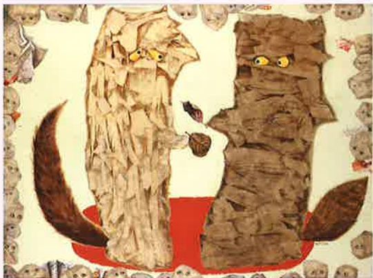
《狐と狸》油彩・板、1973年