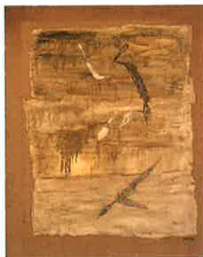
《作品》油彩・キャンバス、1960年