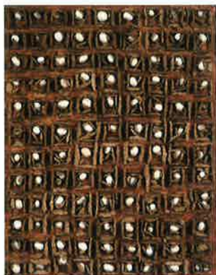
《作品》コルク、綿、紙・キャンバス、1978年

コラーージュの技法をつかった作品は、のちに油彩画と融合します。キャンバスにしわしわの和紙を貼りつけ着色した作品や、布や新聞をあたかもそこに貼りつけているように見える油絵を描いたり、布の端切れを絵の具のように使い画面を構成するものなど、いろいろなコラーージュのバリエーションが生み出されました。