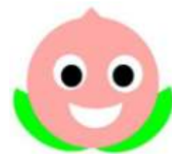
▲下関市市民協働参画条例のマスコットキャラクター「ももしー君」