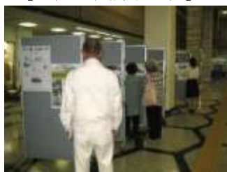
【下関市役所本庁舎】

市民活動団体の活動内容や会の活動方針などをまとめ、ポスター展を開催しました。これまで、技術や予算などでポスターにする事が難しかった団体の方も広報機会を得られ、しものせき市民活動センターに来られない方の目にも留まるように、豊浦、豊田、豊北、菊川地域など市域の広い範囲で実施しました。ポスターをご覧になった市民から団体へ直接お問い合わせもあり、協働による市民活動の啓発と広報機会の拡張につながりました。