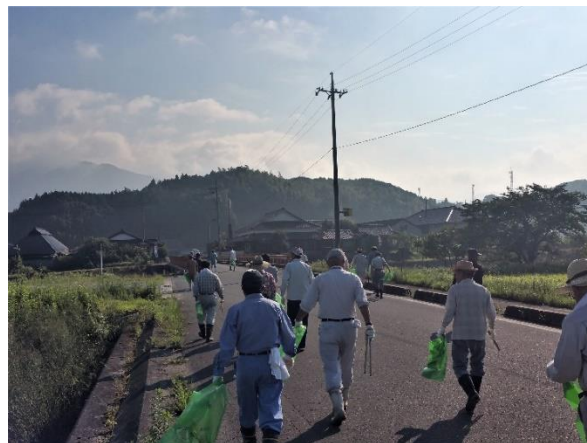
【豊田ほたる街道一斉清掃】