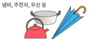
냄비, 주전자, 우산 등