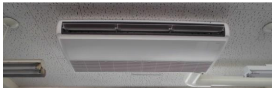
【施工エアコンのイメージ】