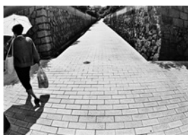
▲吉岡一生《きょう・つれづれ》より

下関で長年にわたり活躍してきた写真家・吉岡一生氏と清水恒治氏。60年以上のキャリアの中での代表作を中心に地域の人や風景、文化を追った作品を紹介します。期 11月20日～令和4年1月10日 ※休館日…月曜日、年末年始 料 一般600円、大学生500円 閩 市立美術館 (☎245-4131)