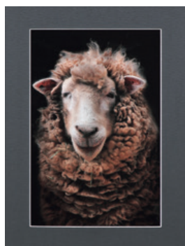
◀教育長賞