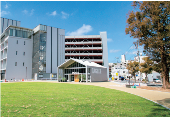
▲「TAGLINE by craftsman coffee roasters」