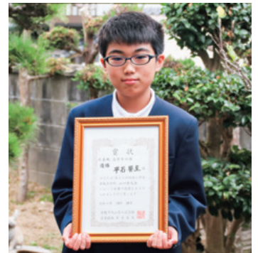
▲1日6回対局し、6戦全勝で優勝。 勝負メシは「ハンバーガー」。

保育園で運命的に出会えた将棋。 みんなも将棋に触れて、 将棋の楽しさを知ってほしい。