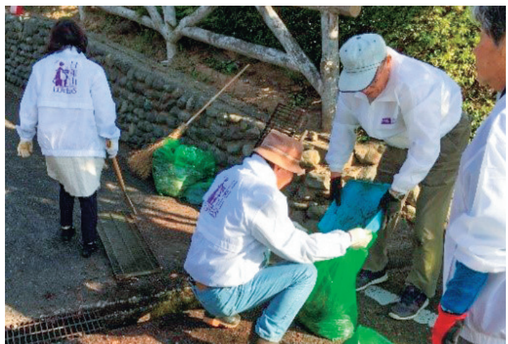
▲「日和山公園愛護会の活動」

歴史を積み重ね、多くの人々が親しみを増していくほどに、公園はより美しく磨かれていく、と思わせます。街中に生まれた、地域活性化に結びつく自主的な公園愛護活動として評価されました。