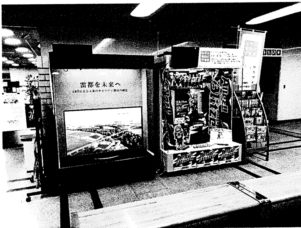
※宇都宮市役所エントランスにて

宇都宮市が大切にしていることは、日々の暮らしの豊かさ。100 年先も宇都宮を訪れる人が、住みたいと思える街になるためにネットワーク型コンパクトシティを目指している。