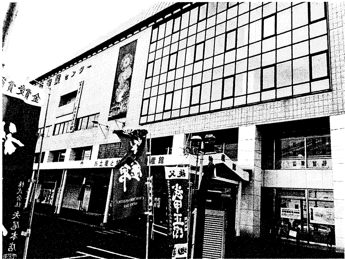
※地場産業センター

これらの活動を継続していくうちに現在でも商店街の空き店舗はゼロを継続しているとのことだった。現在は多店舗展開をする若い世代も育ててきており、全国的に若返りが難しいとされている商店街もある中、手本となる商店街であった。