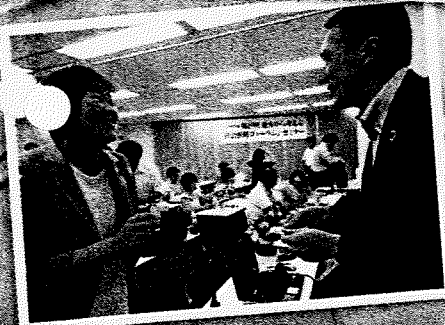
※第19回「地方から考える「社会保障フォーラム」 セミナーの様子