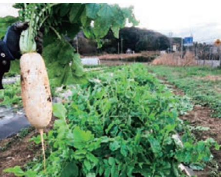
川棚の有機栽培 元気ダイコン

問 農林水産省みどりの食料システム戦略の概要 答 市としての認識は。 問 市としての認識は。 答 重要な課題と認識しており、国の取り組み方向とも歩調を合わせ、中長期的視点で、本市の取り組みを検討していかねければと考えている。 問 下関を有機農業の先進地とするべく取り組みはないか。 答 有機農業の推進に向け検討を始める段階にきていると考えており、遊休農地の再生につながる可能性もある。国の支援施策などを注視し、生産者や県、農協などの関係機関と連携しながら、推進へ向けた取り組みを検討していく。 問 子供たちの食の安全と食育の面で給食の食材に市内産の食材を使用できないか。 答 まずは年一回給食を市内産の食材で行いたい。目標日を定め、関係者みんなで取り組み、新調理場にも生かしたい。