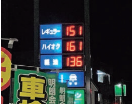
12月23日現在のガソリン価格

問 市政への影響は。 答 原油価格高騰などによる直接的な税収の影響はないが、それにより事業者の経費が増大し、収益が増加しない場合、法人の所得額が減少することになり、連動して国税法人税(額も減少し、本市の法人市民税収も減少することとなる。 問 単価契約業者への影響は。 答 原油価格高騰による事業者への影響を鑑み、単価契約物品について、より一層計画的な発注に努めるよう庁内各課に周知するとともに、その他の対応も検討する。 問 税収の増やし方については。 答 新たに市民に負担を求めめることは極めて困難。人口減少に歯止めをかけ、企業誘致による雇用増大に力を入れることが税収確保につながる。 問 補助金の投入については。 答 プレミアム付商品券事業が考えられるが、国の経済対策を注視していきたい。