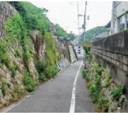
狭あい道路の状況

問 中心市街地北側斜面地調査業務 答 道路整備計画の進捗は。 問 道路整備計画の進捗は。 答 下商会館付近から丸山町4丁目中心付近を通り市道丸山線までをつなぐ路線を選定した。既設市道を6mに拡幅し、地区外への移転代替え地提供はなく、用地買収で対応予定。 問 サウンディング結果、民間開発行為を誘導できるかの判断の方針は。 答 事業者からは地区住民との合意形成への市のサポート要請や、住居系の土地利用に係る提案が考えられるなどの意見があった。官民連携事業手法を現在調査中で、地域住民との合意形成に注力したい。 問 入江町周辺地区土地区画整理事業 答 進捗状況、今後の進め方は。 問 令和3年度に三百目本町線や王江小学校・第二幼稚園を含むエリアで基本調査を実施した。今後、まちづくり基本構想を検討し、併せて一方通行の解消や地盤の高低差の影響を極力抑えた土地利用計画も検討し、課題解決に取り組む。