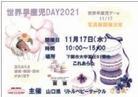
世界早産児デーの啓発活動

▼低出生体重児 問 本市の現状と支援方法は。 答 令和元年の低出生体重児は168人で、支援は医療機関からの連絡を受けて家庭訪問した際にアドバイスや、未熟児養育医療給付申請時に支援団体などの紹介をしている。 ▼医療的ケア児 問 本市の医療的ケア児の現状は。 答 令和元年度時点は38名である。 問 医療的ケア児への支援は。 答 医療的ケア児限定の支援はない。障害の状況に応じて、各種サービスの中で通所支援や障害児福祉手当・特別児童扶養手当・日常生活用具の給付を行っている。 問 令和3年9月に医療的ケア児及びその家族に対する支援に関する法律が施行されたが本市の取り組みは。 答 医療的ケア児支援地域連携会議を設置し、関係部局と連携して保育所等での医療的ケア児の受け入れ体制の整備等に取り組んでいる。