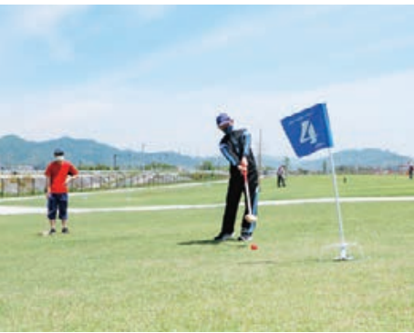
乃木浜グラウンド・ゴルフ場

問 乃木浜総合公園整備 答 進捗と今後のスケジュールは。 問 進捗と今後のスケジュールは。 答 第1・第2多目的グラウンドや庭球場、グラウンド・ゴルフ場などの整備が完了し、現在、第3多目的グラウンドを整備している。今後は自由広場や野球場を整備していく。 問 令和4年3月末で長府扇町第2運動広場が廃止となるが、多目的グラウンドは、代替グラウンドとして有効活用できるか。 答 ソフトボール協会には多目的グラウンドの利用を案内しており、移動式外野フェンスなどは、事前に相談をいただいた上で、利用者が設置して利用することができる。 問 周辺整備 答 高磯交差点から国道2号までの道路整備の状況は。 問 高磯交差点から国道2号までの道路整備の状況は。 答 歩道設置や車道拡幅、高磯折第一踏切の改良を進めており、令和3年度から工事着手し、令和8年度の完成を目標に事業を進めていく。