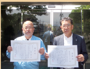
コプロス・青木建設王喜汚水3号 幹線布設工事(第1工区)共同企業体 (株)コプロス