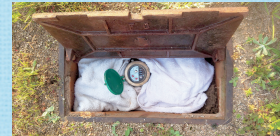
水道メータボックスの中にタオルを入れている様子

また、水道メータボックスの中にタオルや布きれを入れて保温することや、冷え込みが予想される日の前日の夜間に蛇口から少量の水を出しておくことで凍結しにくくなります。