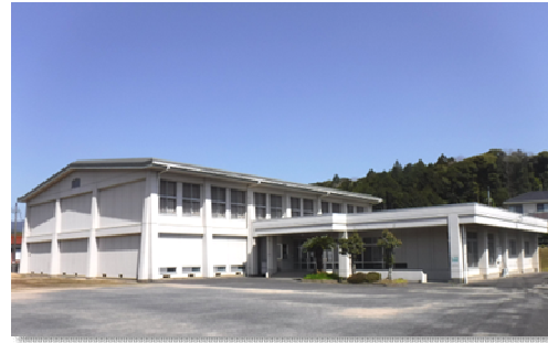
下関市豊田農村勤労福祉センター