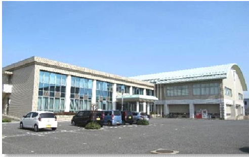
下関市勤労者総合福祉センター