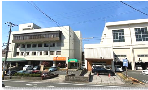
下関市勤労福祉会館