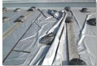
体育館屋根防水 応急処置

本施設は、中東地区の重要な避難所であることから、これらの危険な状態の早期解決を図るために、本館耐震補強工事と体育館屋根防水工事を早急を実施する必要があります。