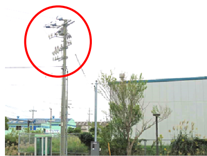
高圧気中開閉遮断器

本施設は、企業が多く立地する長府東部地区にあることから、波及事故となった場合、周囲の立地企業等に多大な損害を及ぼす可能性があり、また予防保全によって、設備の故障等による利用者サービスの低下を防ぐ意味においても、早急に更新を行います。