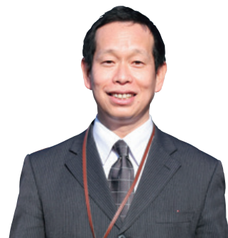
広報戦略課 シティプロモーション