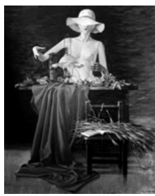
▲古舘充臣「ランプのある静物」1982年

④4月16日～6月12日 ※1階は5月29日(日)まで ④月曜日 ④2階展示室では19世紀末～20世紀にかけてヨーロッパで作られたビーズバッグのコレクションなどを展示。1階展示室では下関ゆかりの洋画家・古舘充臣の作品などを紹介します。 ④料一般210円、大学生100円 ④市立美術館(☎245-4131)