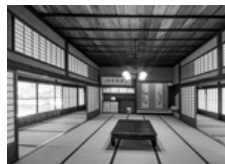
▲撮影 写真家 坂本マスオ