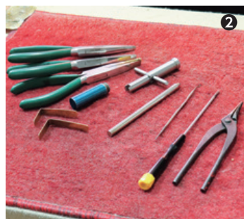
①息漏れがないかを調べます。②使う道具も自分流にアレンジ。③まずはお話を聞くところから。持ち主の想いに寄り添います。