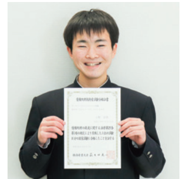
▲スマホは高校生から。パソコンも 動画やネットを見る程度でした。

自信をもって人に誇れるもの、 自分の芯を持ちたかった。 僕にとって、それがITでした。