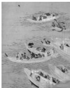
▲長沢栄州《源平合戦・那須与一図》より(部分)

期6月18日～8月14日 休月曜日(7月18日は開館) 内「海」と「美術」の関係という古くて新しいテーマに目を向けた、下関だけの展覧会です。2022年に生誕100年を迎えた宮崎進(1922～2018年)の作品も紹介します。 料一般210円、大学生100円 市立美術館(☎245-4131)