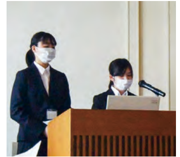
▲プレゼンテーションの様子。 アイデアの斬新さと実現可能性 の高さが評価されました。

2021年度 学生海洋 ビジネスアイデアコンテストで 最優秀賞を受賞 「水中ドローンで藻場の回復」