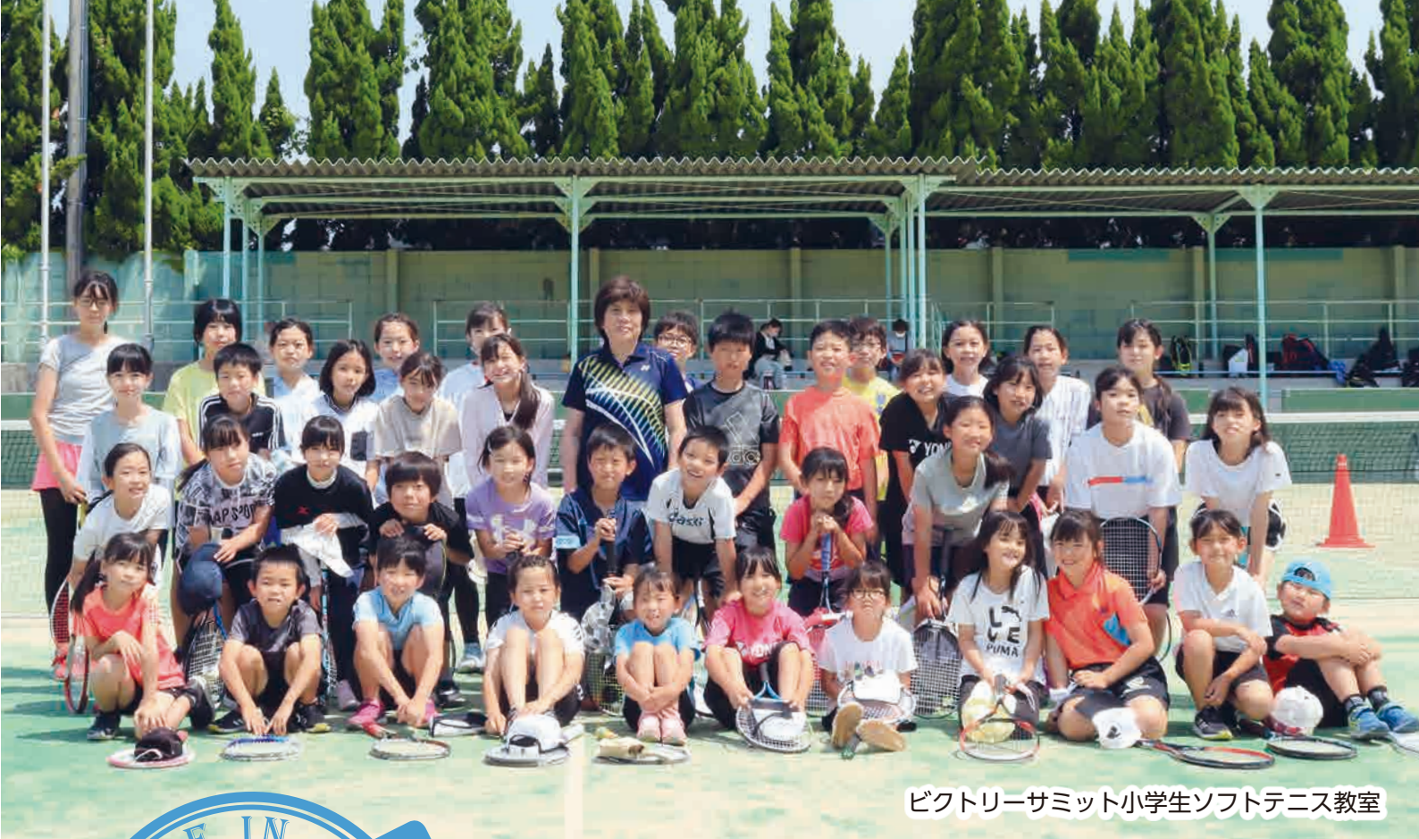
ビクトリーサミット小学生ソフトテニス教室