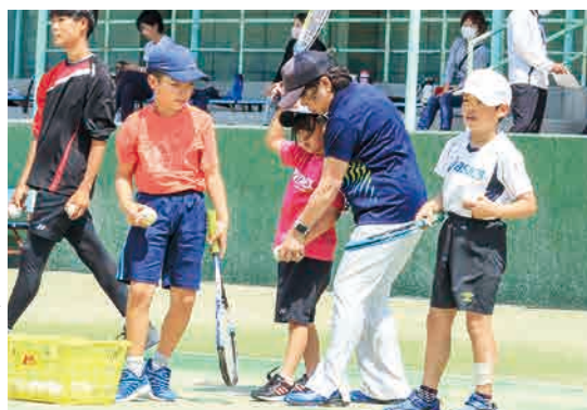
▶コツをつかみや正しいよう、ゆっくりと体の動きを教えてくださいます。