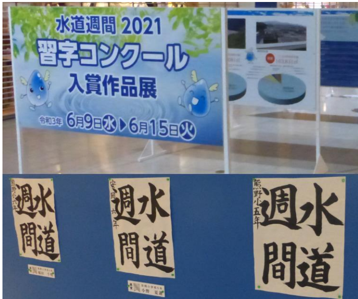
水道週間 習字コンクール 入賞作品展