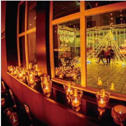
♡ Q ▼ @anisan.kさん