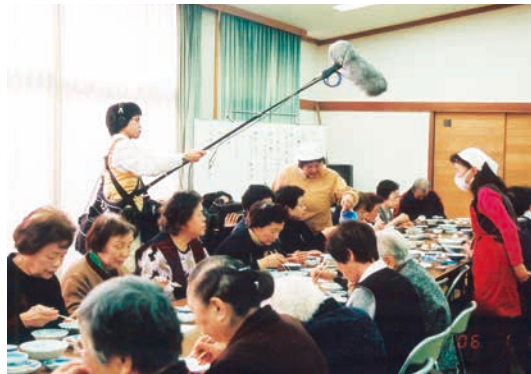
◀テレビでも活動が紹介されました。(2006年1月)