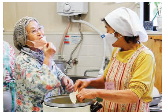
▶炊きたての栗ごはんの味見。「どんなかね?」「うん、上等」