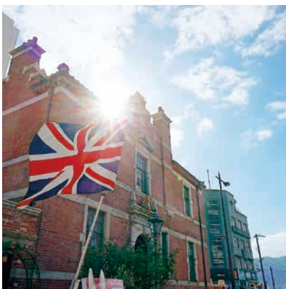
♡ Q ▼ @sky_45_323さん