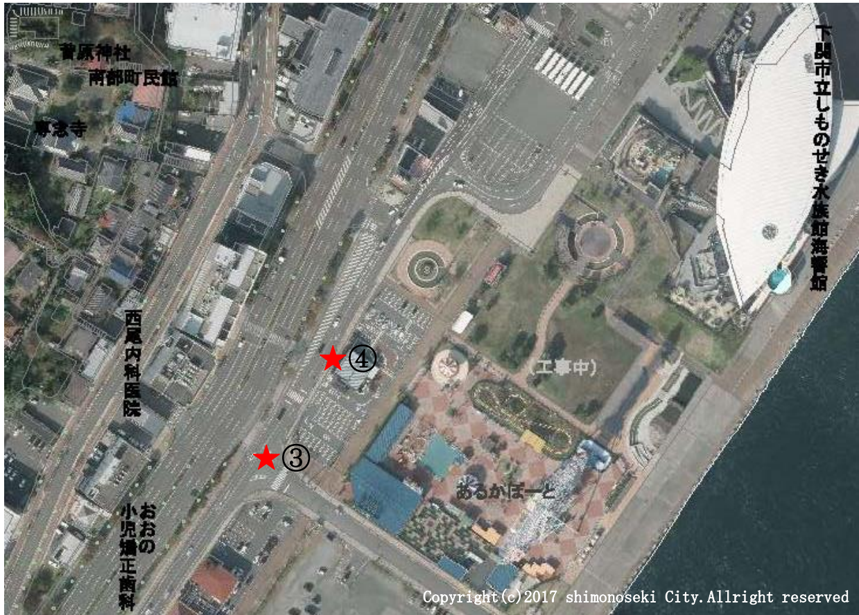
③ あるかぼーとの歩道 (下関市あるかぼーと2番)